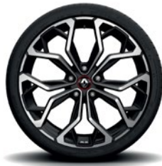
Interlagos, hopea 19" kevytmetallivanteet