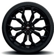
Interlagos, musta 19" kevytmetallivanteet