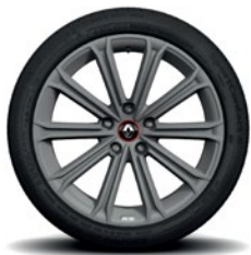
Estoril 18" kevytmetallivanteet