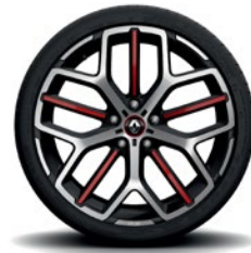
Jerez 19" kevytmetallivanteet

Hinnat ovat suositusintoja ja varaamme oikeuden muuttaa niitä. Lisävarusteet saattavat korvata vakiovarusteita. Hintoihin lisätään paikkakuntaan kohtaiset toimituskulut. Kuvien autot erikoisvarustein.