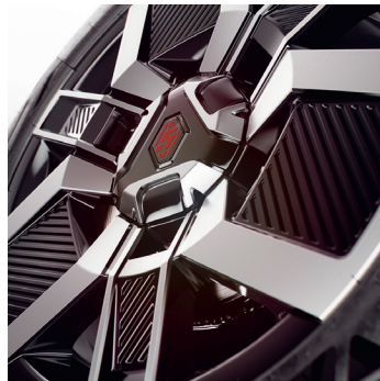
techno: 18" kevytmetallivanteet techno