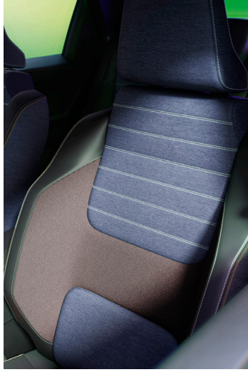
techno: 100 % kierrätetty verhoilu farkkukangastehosteilla