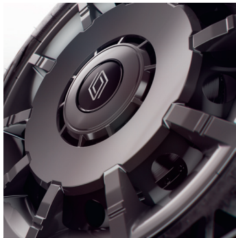
evolution: 18" teräsvanteet koristekapseleilla disco