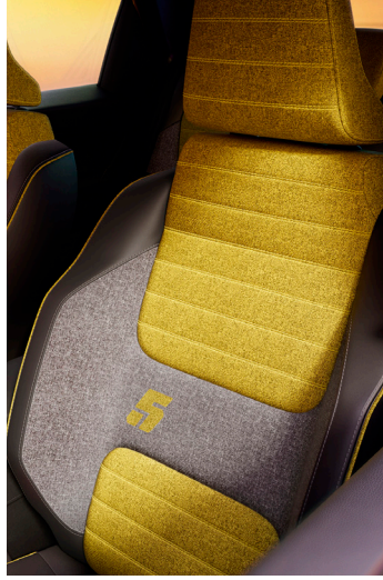
iconic cinq: 100 % kierrätetty verhoilu keltaisilla tehosteilla