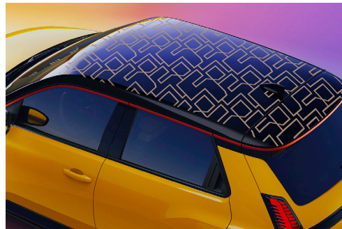
unlimited 5 kulta

Lisävarusteet saattavat korvata vakiovarusteita. Olosuhteiden vaihtelut, pakkanen, lumi, jää, sade ja muut ulkopuoliset tekijät voivat vaikuttaa auton toimintaan ja lisälaitteisiin. Esimerkiksi jäätyneet tai lumen peittämät auri/tutka ei voi toimia ja huono keli voi häiritä järjestelmiin liittyvän kameran näkyvyyttä. Kysy lisää myyjältä.