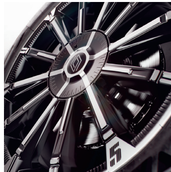
iconic cinq: 18" kevytmetallivanteet chrono