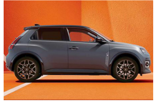
mattaväri schiste satiiniharmaa