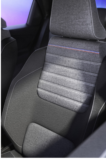
evolution: harmaa verhoilu koristetikkauksilla