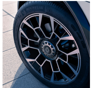
Roland-Garros: 18" kevytmetallivanteet electro

Katso rengastiedot osoitteesta renault.fi/rengastiedot