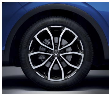
Intens: 18" kevytmetallivanteet "Fleuron"