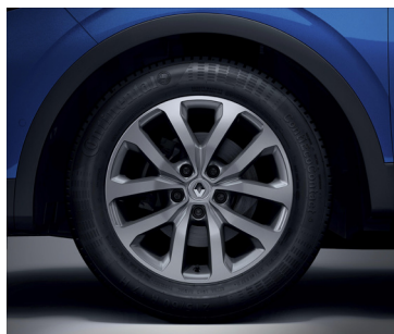
Zen: 17" kevytmetallivanteet "Aquila"