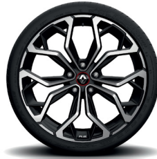
Interlagos, hopea 19" kevytmetallivanteet