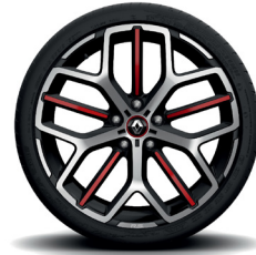
Jerez 19" kevytmetallivanteet

Hinnat ovat suositushintoja ja varaamme oikeuden muuttaa niitä. Lisävarusteet saattavat korvata vakiovarusteita. Hintoihin lisätään paikkakuntaan liittyvät toimituskulut. Kuvien autot erikoisvarustein.