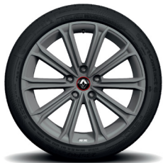
Estoril 18" kevytmetallivanteet