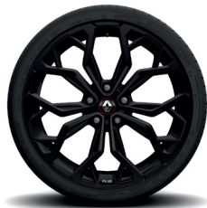
Interlagos, musta 19" kevytmetallivanteet