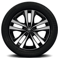
18" kevytmetallivanteet "Argonaute"