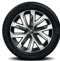
19" kevytmetallivanteet "Quartz" (lisävaruste)

Hinnat ovat suositushintoja ja varaamme oikeuden muuttaa niitä. Lisävarusteet saattavat korvata vakiovarusteita. Hintoihin lisätään paikkakuntakohtaiset toimituskulut. Kuvien autot erikoisvarustein.