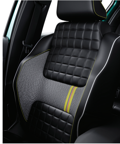
iconic: verhoilu 100 % kierrätettyä kangasta ja pinnoitettua kangasta sekä keltaiset yksilöinnit