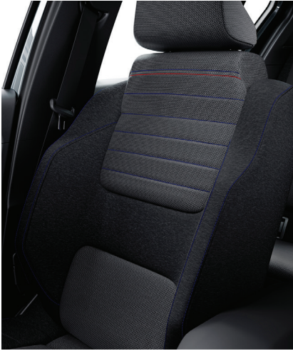
evolution: harmaa verhoilu koristetikkauksilla