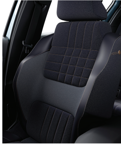
techno: 100 % kierrätetty verhoilu tummalla farkkukankaalla ja kuparin värisillä yksilöinneillä