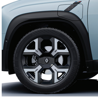
techno: 18" kevytmetallivanteet sixties