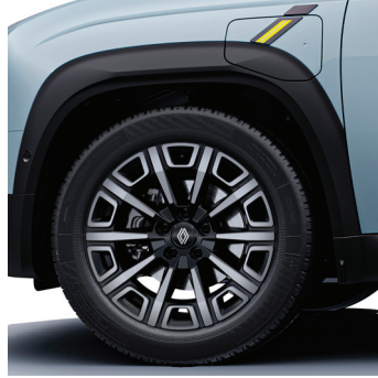
iconic: 18" kevytmetallivanteet parisienne

Katso rengastiedot osoitteesta renault.fi/rengastiedot