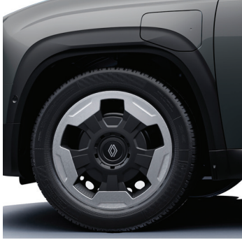
evolution: 18" teräsvanteet koristekapseleilla jogging